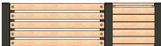
Ławka Grande z donicą 100